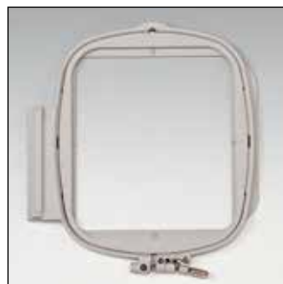
Пяльцы для квилтинга 150 x 150 мм

Вышивайте красивые повторяющиеся рисунки или бордюры. Идеально подходят для широкого диапазона изделий: от модной одежды до домашнего декора.