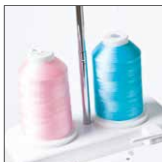
Стойка для 2-х катушек

С новой вышивальной лапкой с LED указкой найти идеальное положение иглы при вышивании очень просто. Светодиодный указатель четко показывает, куда опустится игла, а регулировка осуществляется простым нажатием нескольких кнопок на LCD экране.