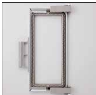
Бордюрные пяльцы 300 x 100 мм

Вышивайте красивые повторяющиеся рисунки или бордюры. Идеально подходят для широкого диапазона изделий: от модной одежды до домашнего декора.