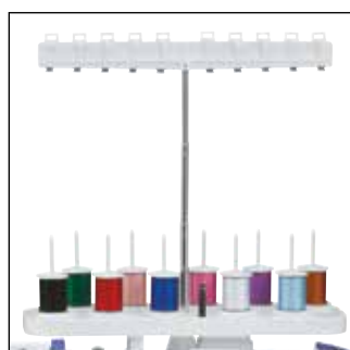
Стойка для 10 катушек

Идеально подходят для квилтинговых проектов. Создавайте квадратные блоки квилта без особых усилий. Прочные пяльцы, которые туго удерживают ваше изделие и справляются с особо тяжелыми тканями, отлично подойдут для новичков и экспертов.